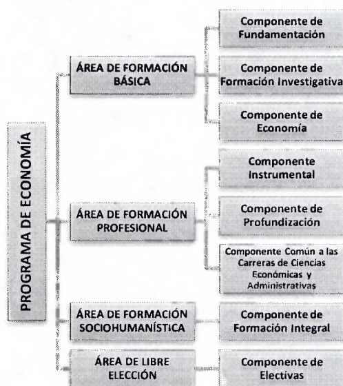
Ilustración 1: ESTRUCTURA DEL PLAN DE ESTUDIOS DEL PROGRAMA DE ECONOMÍA